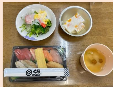
生活介護開所記念