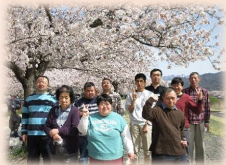
4月 馬見ヶ崎公園にてお花見 天気も良く桜も満開でした！