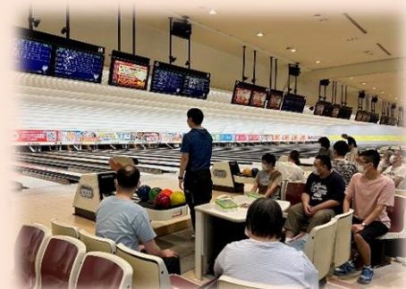
7月 ミニレクボーリング ハイタッチをして大盛り上がり！